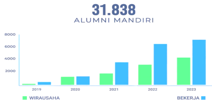
Figure 2. Presentase Alumni SMA Double-Track

Banyak kisah inspiratif dari alumni Program SMA Double-Track yang menunjukkan bahwa setelah mengikuti pelatihan di sekolah, mereka mampu membangun usaha mandiri bahkan hingga mempekerjakan karyawan. Sebagian alumni bahkan berhasil mencapai omzet yang melampaui pelaku usaha senior. Berdasarkan data tahun 2019–2023, tercatat sebanyak 31.838 alumni Double-Track telah mandiri, baik bekerja maupun berwirausaha. Gambaran lebih jelasnya dapat dilihat pada grafik berikut (Bidang Pembinaan Pendidikan SMA Dispendik Jawa Timur, 2024):