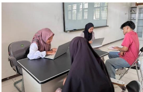
Gambar 3. Wawancara dengan mahasiswa

Hasil penelitian menunjukkan bahwa integrasi kaligrafi dalam pembelajaran menulis Arab melalui pendekatan visualisasi artistik memberikan dampak multidimensional yang meliputi peningkatan keterampilan teknis, pengembangan kognitif, pembentukan karakter, serta penguatan identitas kultural dan spiritual mahasiswa. Temuan ini mengkonfirmasi dan memperluas penelitian-penelitian sebelumnya tentang efektivitas pembelajaran kaligrafi dalam konteks pendidikan bahasa Arab.