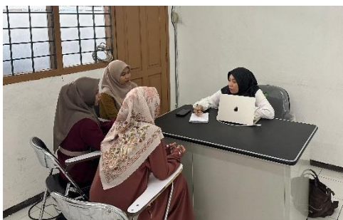
Gambar 2. Wawancara dengan dosen pengampu